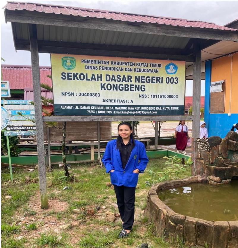
Gambar 1 Dokumentasi SD Negeri 003 Kombang