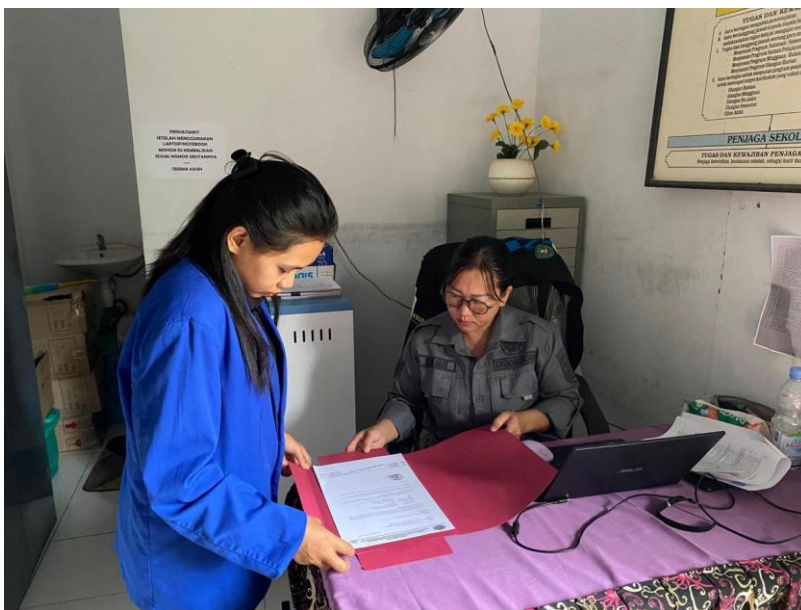
Gambar 2 Dokumentasi Ijin Penelitian