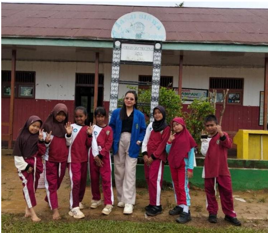
Gambar 4 Dokumentasi Pemungutan Sampah Di Lingkungan Sekolah.