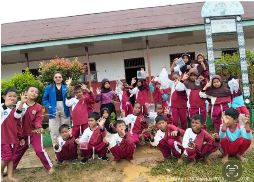
Gambar 3 Dokumentasi JumatBersih