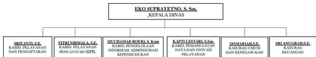
Gambar 2. Struktur Organisasi Dinas Kependudukan dan Catatan Sipil Kota Samarinda