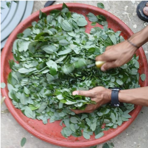
Gambar 1. Pencacahan Daun Gamal