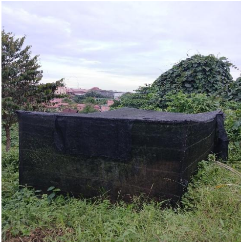
Gamambar 7. Naungan