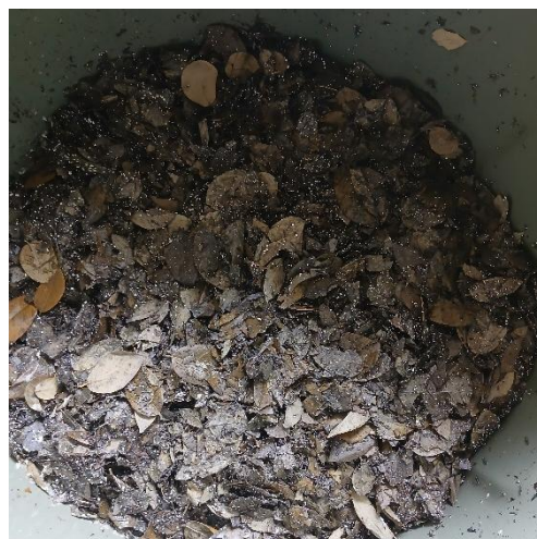
Gambar 6. Bokashi Yang sudah di Fermentasi