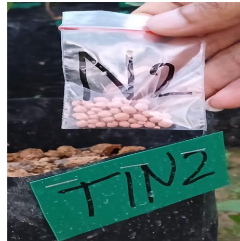
Gambar 10. Aplikasi NPK Phonska