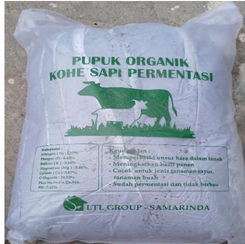
Gambar 2. Kotoran Sapi