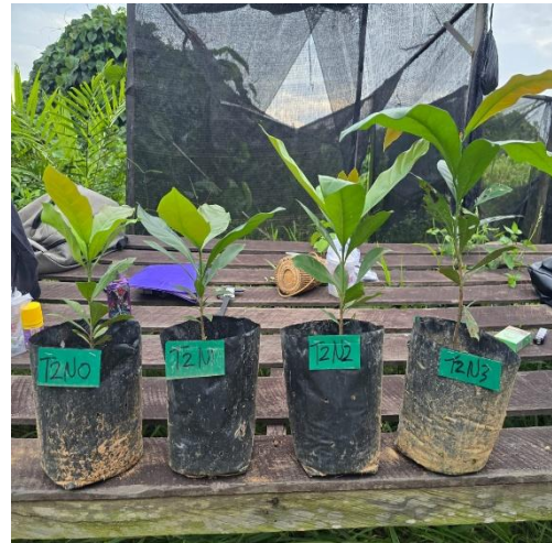
Gambar 16. Tinggi Tanaman Terbaik B2N3