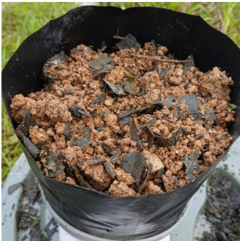
Gambar 9. Aplikasi Bokashi