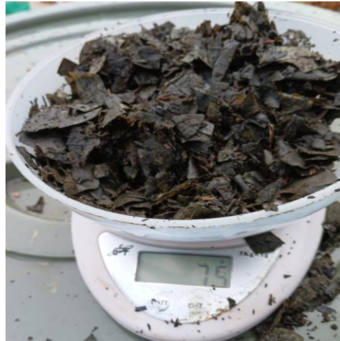
Gambar 8. Penimbangan Bokashi