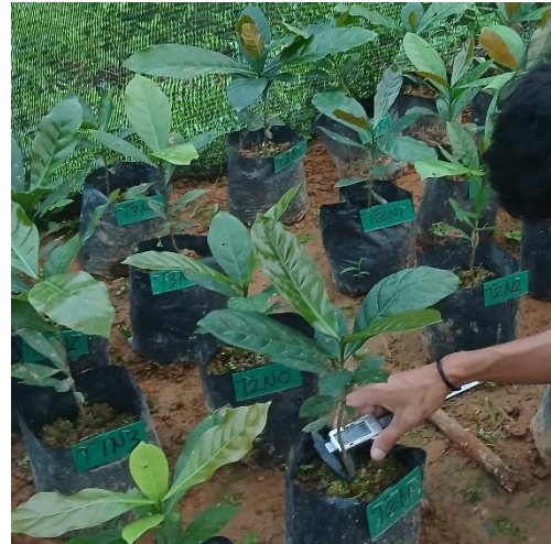
Gambar 14. Pengukuran Diameter Batang