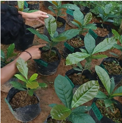
Gambar 15. Jumlah Daun