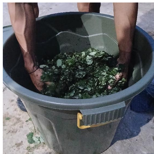
Gambar 5. Pencampuran