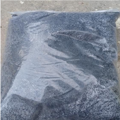
Gambar 3. Arang Sekam