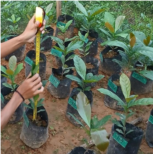
Gambar 13. Pengukuran Tinggi