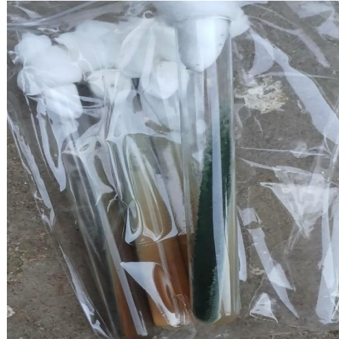
Gambar 4. Trichoderma. sp