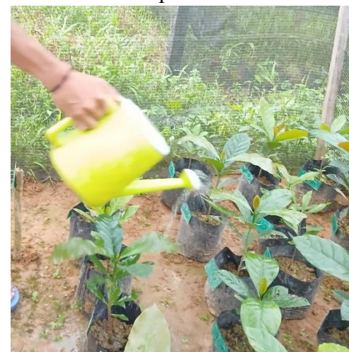
Gambar 12. Penyiraman