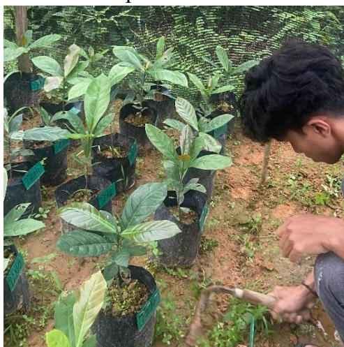
Gambar 11. Pembersihan Gulma