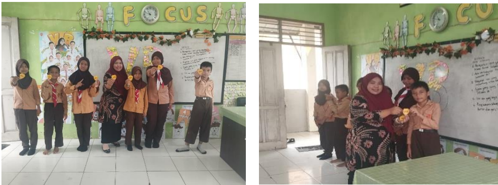
Gambar 1 Penyerahan Sticker kepada siswa yang terpilih pada Program Student of the Week pada akhir semester

Dokumen pendukung program Student of the Week meliputi pedoman pelaksanaan program, kriteria dan indikator penilaian karakter, lembar observasi atau catatan sikap siswa, serta bentuk penghargaan yang diberikan, seperti stiker Lencana Kebaikan atau pengumuman resmi pada sosial media kelas serta grup Whatsapp kelas. Dokumen-dokumen tersebut berfungsi sebagai bukti administrasi dan acuan dalam pelaksanaan program agar berjalan secara terstruktur dan dapat dievaluasi secara berkelanjutan. Berikut adalah beberapa media dan dokumentasi program yang telah berjalan :