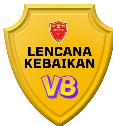
Gambar 2 Media publikasi berupa flyer yang dibagikan pada media sosial dan Sticker bertuliskan “Lencana Kebaikan”