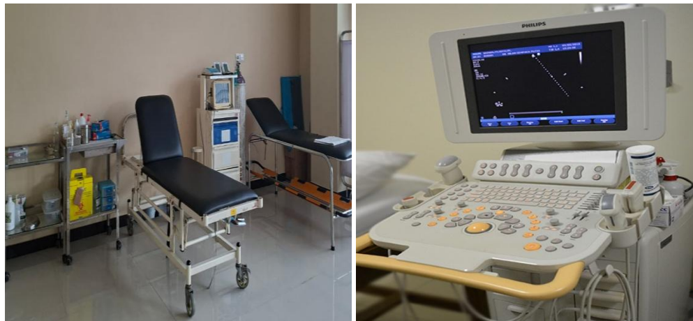
Gambar 4.1 Alat uji pemeriksaan dispepsia

Berdasarkan kutipan diatas, peneliti melakukan triangulasi method melalui observasi sebagaimana data berikut