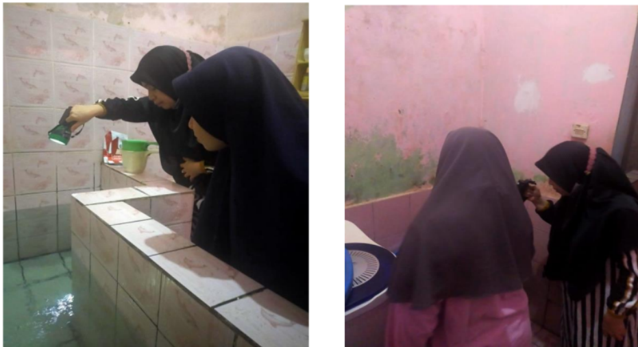
Gambar 2. Pemeriksaan Jentik dan Menjelaskan Ciri-ciri Jentik

observasi sekaligus konseling dan menyampaikan hal-hal penting tentang cara melaksanakan 3M Plus, seperti menguras dan membersihkan tempat penampungan air dengan baik dan benar agar tidak ada jentik yang tersisa, menutup tempat penampungan air, mengubur barang bekas, sampah jenis apa saja yang bisa menampung air, tidur menggunakan kelambu/ lotion anti nyamuk/ spray anti nyamuk dll. Warga juga diajarkan cara mengenali ciri-ciri nyamuk aedes aegypti, serta tanda dan gejala manusia menderita DBD. Selain itu warga dianjurkan menjaga kebersihan dalam rumah dan lingkungan sekitar rumah serta menjaga pola makan dan banyak mengkonsumsi sayur dan buah agar imun tetap terjaga dan tidak mudah sakit. Kegiatan kunjungan dan pendampingan warga dalam memahami 3M Plus diperlihatkan pada Gambar 2.