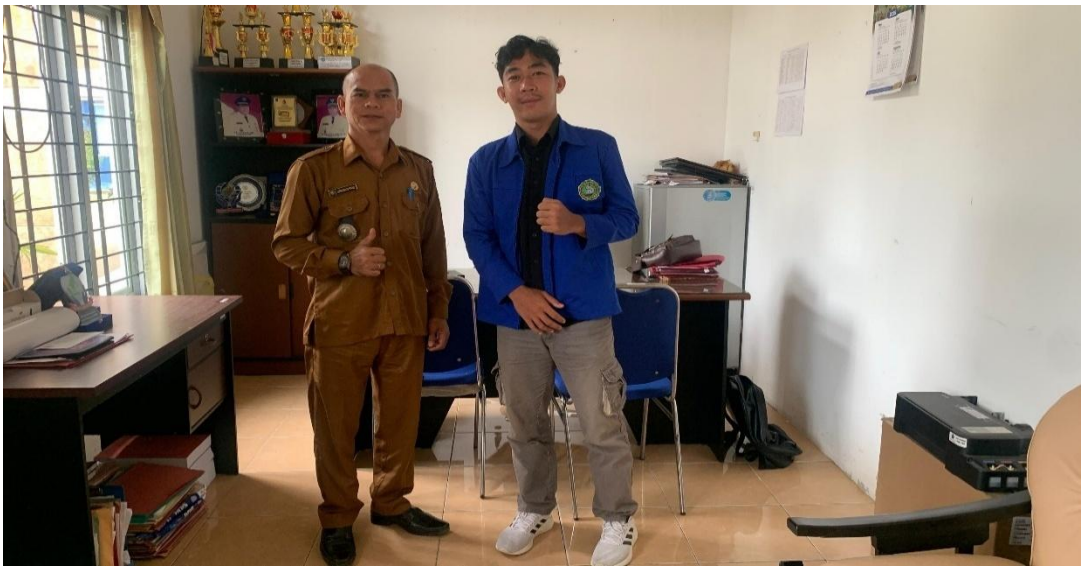
Sumber : Peneliti 5 Mei 2025