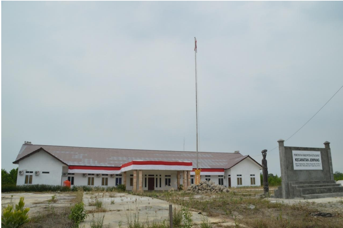
Kantor Kecamatan Jempang