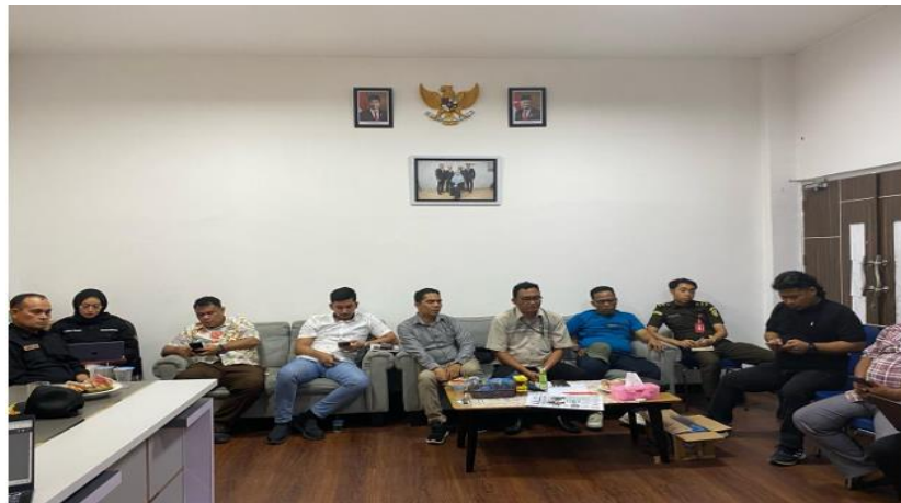
Gambar 1.7 Rapat Koordinasi Sentra Gakkumdu Kota Samarinda

Kegiatan rapat ini berjalan dengan baik dan memberikan pemahaman diskusi juga sebagai bekal kedepan bagi Sentra Gakkumdu Kota Samarinda untuk dapat menjadi lebih baik khususnya menghadapi Pilkada tahun 2024 mendatang.