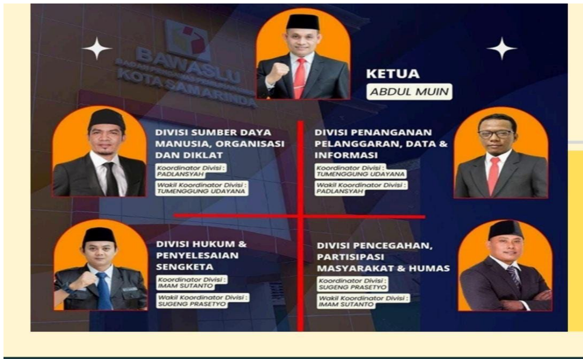
Gambar 1. Struktur Organisasi Bawaslu Kota Samarinda