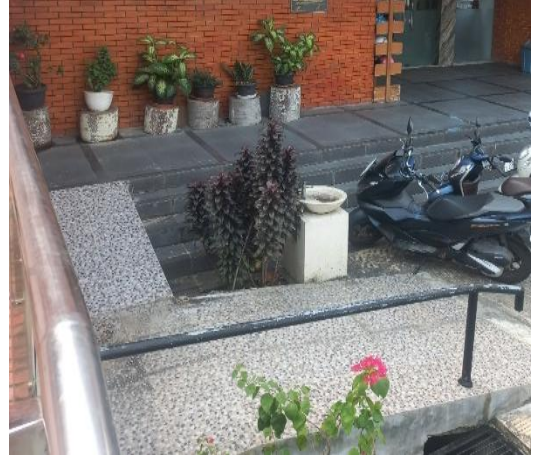
Gambar 10 Jalur Ramp Pada Dinas Perpustakaan