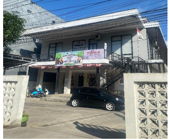
Bangunan Gedung Tidak Ada lift dan Pelayanan Dilantai Atas