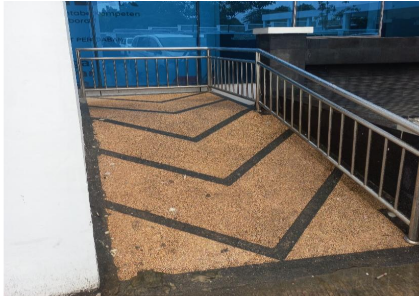
Belum Ramah Disabilitas (Dinas Perpustakaan)