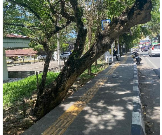
Gambar 6. Jalur pemandu Guiding Block terhalang pohon