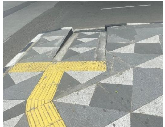
Jalur Ramp untuk trotoar tinggi