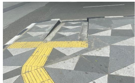
Gambar 4. Jalur Ramp untuk trotoar tinggi