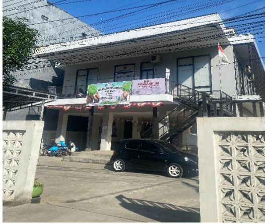
Gambar. 9 Bangunan Gedung Tidak Ada lift dan Pelayanan Dilantai Atas