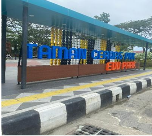
. Taman Cerdas