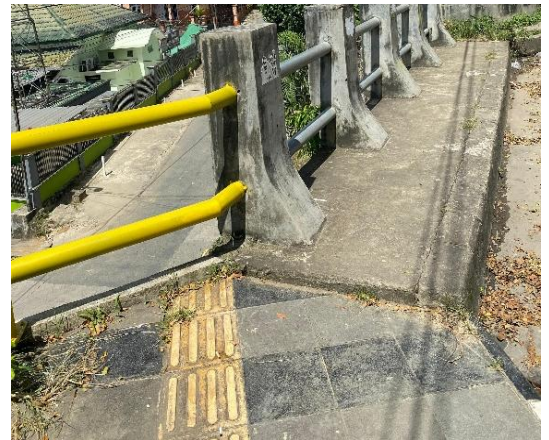
Gambar 8. Membahayakan Pengguna Jalur Pemandu