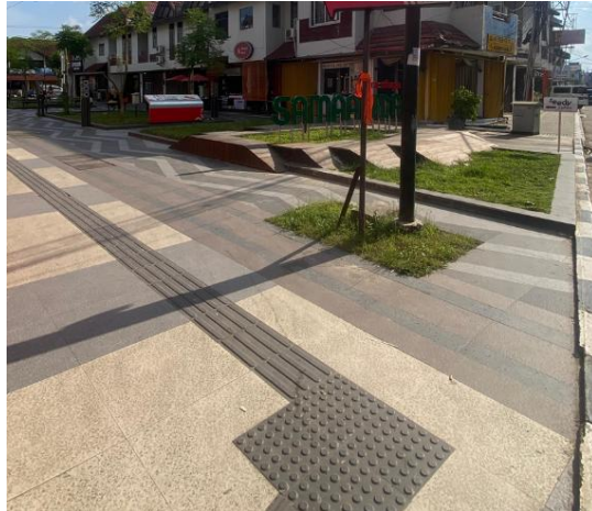
Gambar 5. Jalur Pemandu Guiding Block Berwarna Hitam Pada Kawasan Citra Niaga