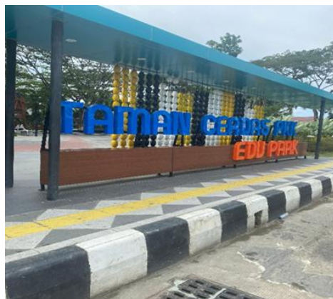
Gambar 1. Taman Cerdas