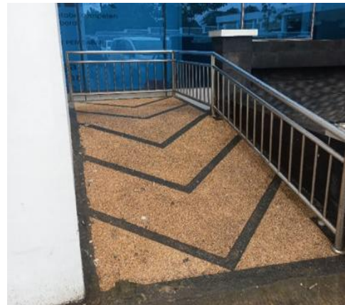
Gambar 2. Jalur Ramp pengguna kursi roda