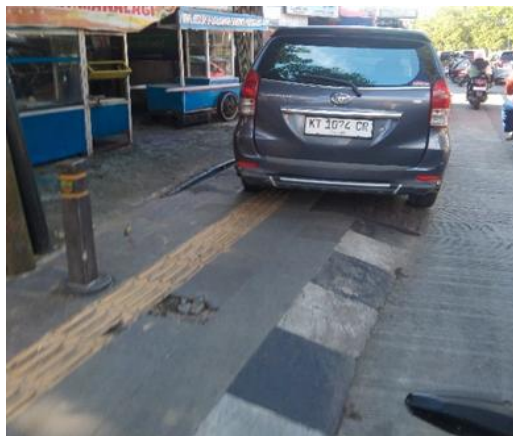
Gambar 7. Trotoar terhalangi Kendaraan