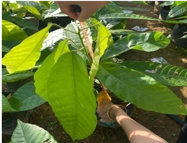
(a) Pengambilan Data Tinggi Tanaman Ke 3 (12MST)