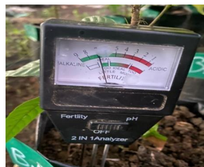
(d) pH Tanah Setelah Penelitian (B2N2) (pH = 6,3)