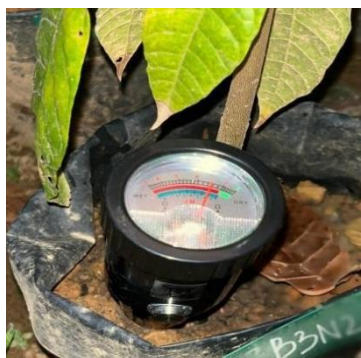
(e) pH Tanah Setelah Penelitian (B3N3) (pH = 6,4)