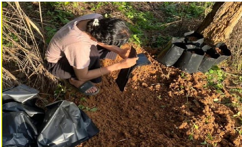
Gambar 3. Pengisian Polybag