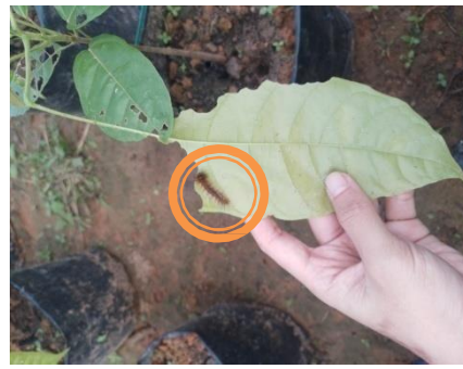
(c) Pengendalian hama ulat bulu secara manual