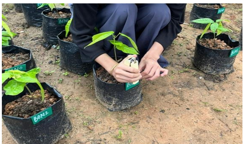
Gambar 5. Pemasangan Label