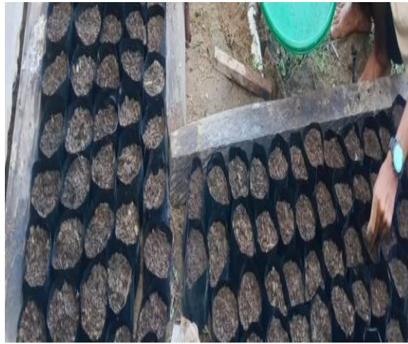
(a) Umur Pembibitan 0 hari