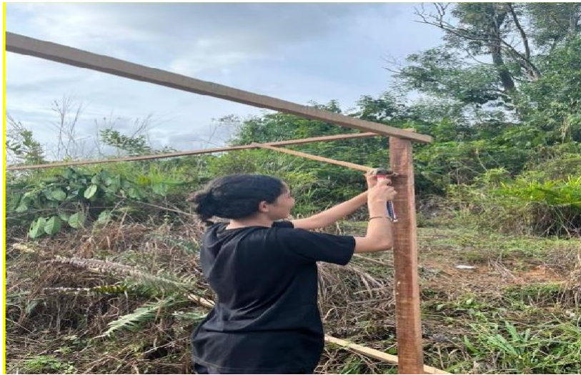
(a) Pembuatan Kerangka Naungan