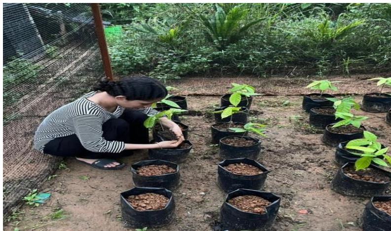
Gambar 4. Pemindahan Bibit Kakao