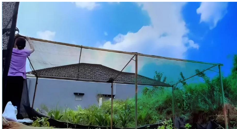
(b) Pemasangan Paranet