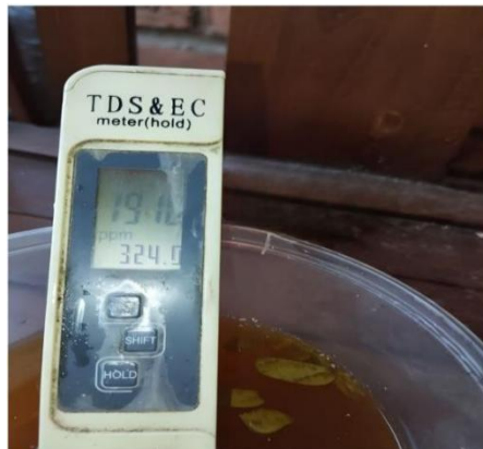
(e) Ukuran Kepekatan Biosaka (324 ppm)