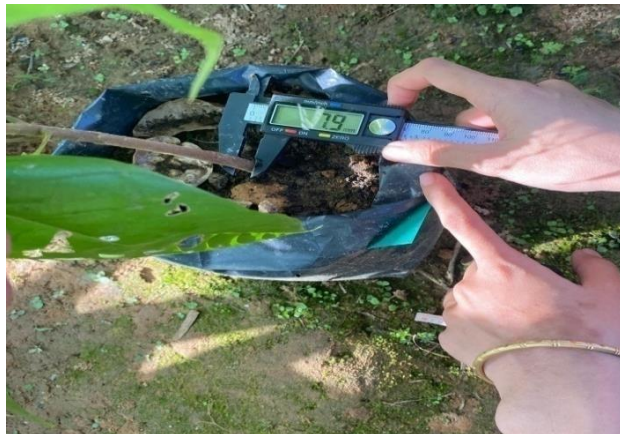
(b) Pengambilan Data Diameter Batang Ke 2 (8MST)