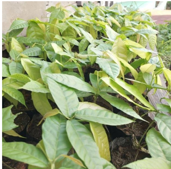
(b) Umur Pembibitan 30 hari