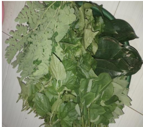
(a) Bahan-bahan Biosaka