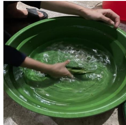
(b) Campuran Bahan-bahan biosaka dan air