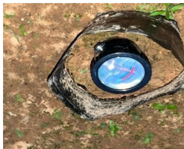
(a) pH tanah sebelum penelitian (pH = 4,7)