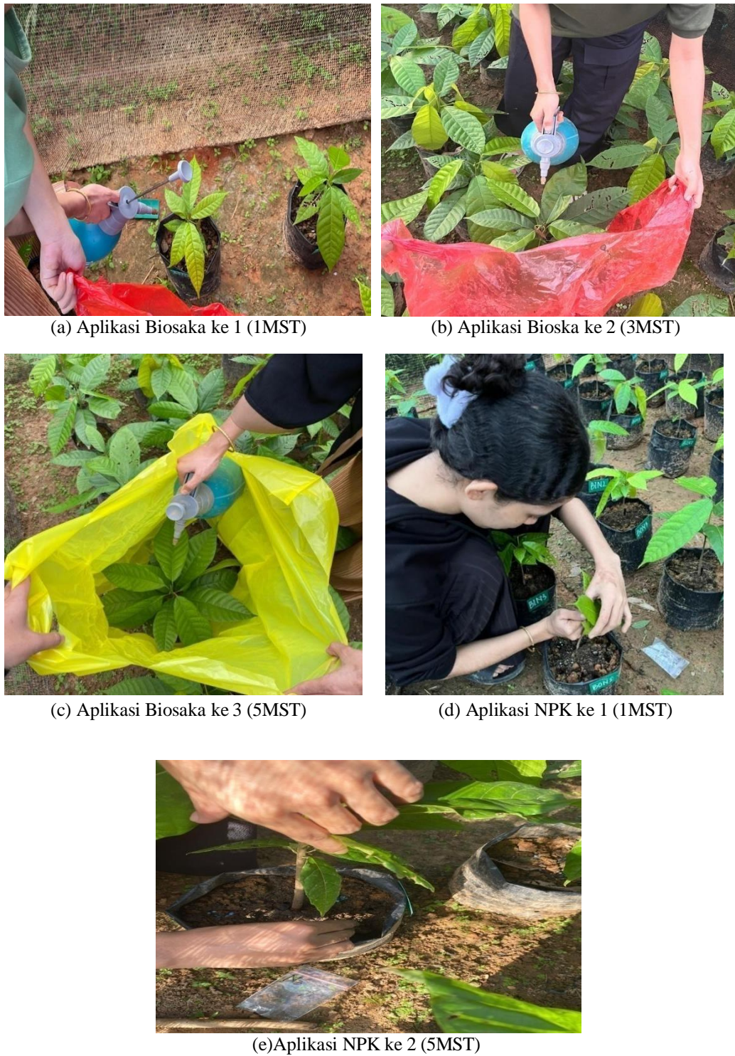
Gambar 7. Pengaplikasian Biosaka dan Pupuk NPK Mutiara