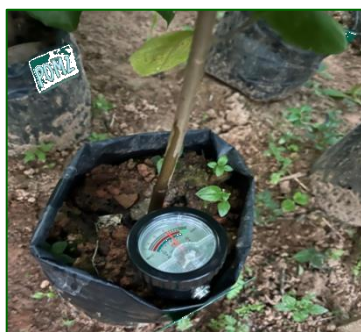
(c) pH tanah setelah penelitian (B1N1) (pH = 6,3)