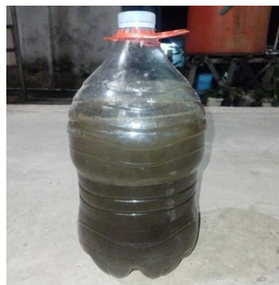
(d) Hasil Biosaka