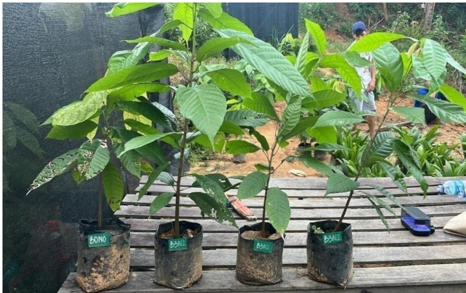
Gambar 9. Tanaman Terbaik (B3N2)