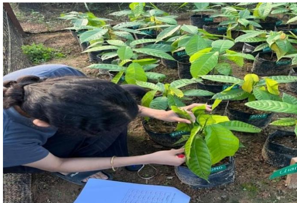
(c) Pengambila Data Jumlah Daun Ke 1 (4MST)