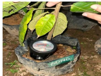
(b) pH tanah setelah Penelitian (B0N0) (pH = 6,2)