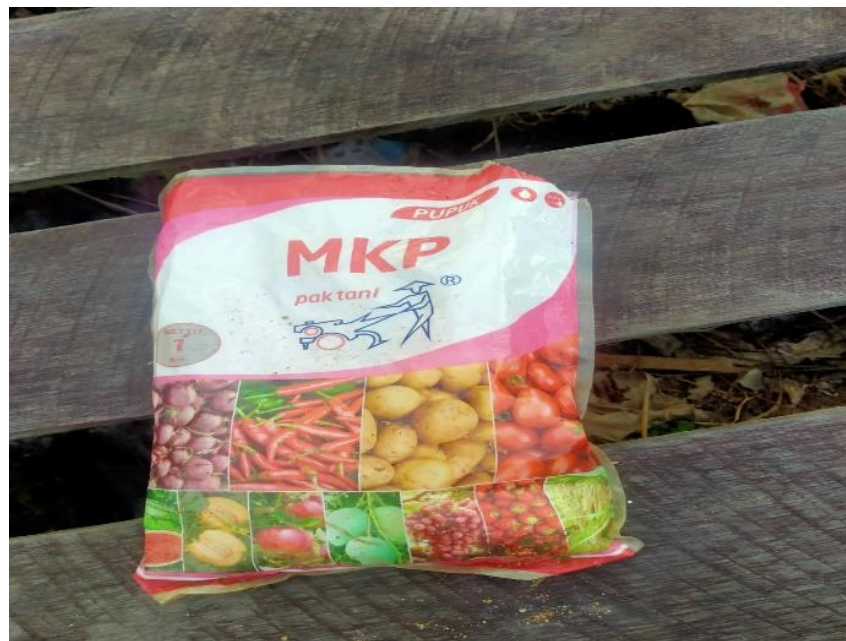
Gambar 4. pupuk MKP