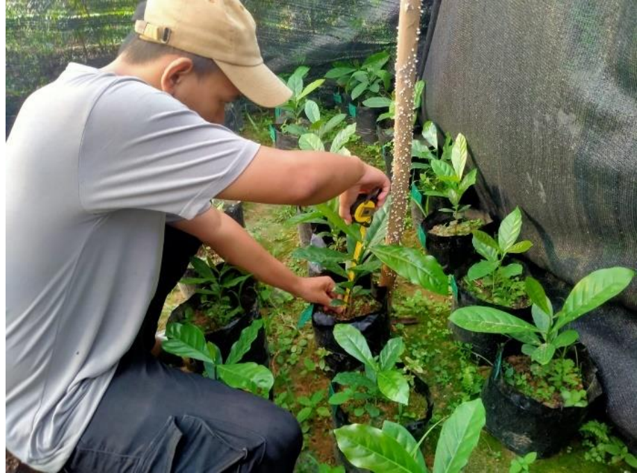
Gambar 13. Penghitungan tinggi tanaman umur 90 HST