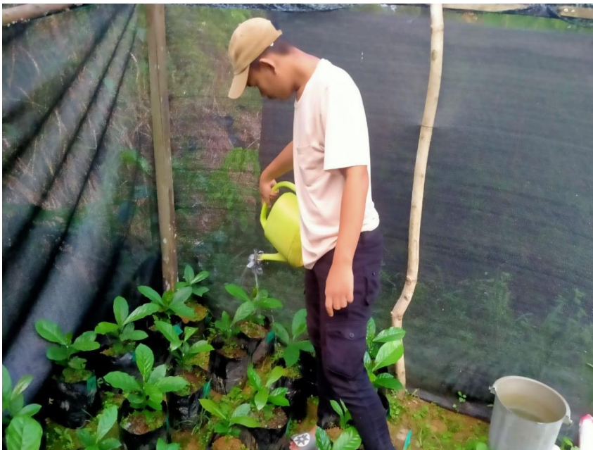
Gambar 12. Penyiraman Bibit Kopi