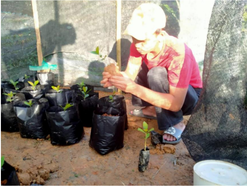
Gambar 11. Pemindahan Bibit kopi Umur 1 Bulan