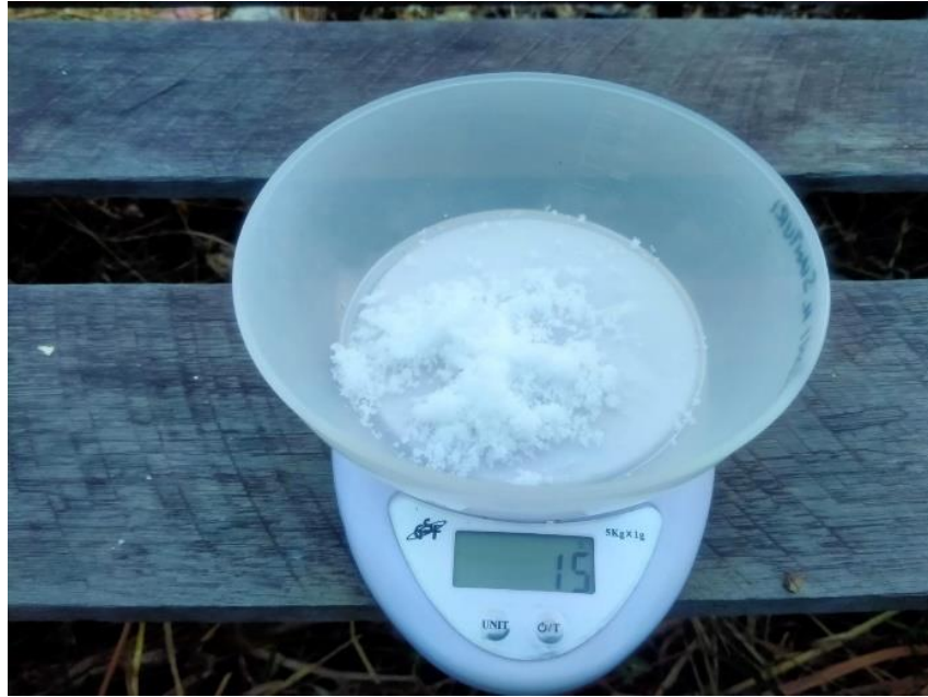
Gambar 9. dosis MKP 15 gram