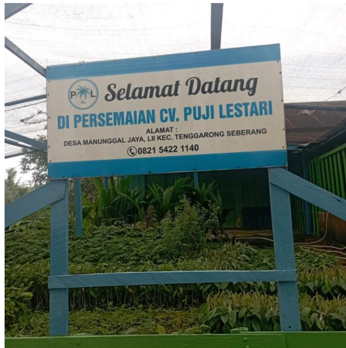
Gambar 1. Sentra Bibit Kopi