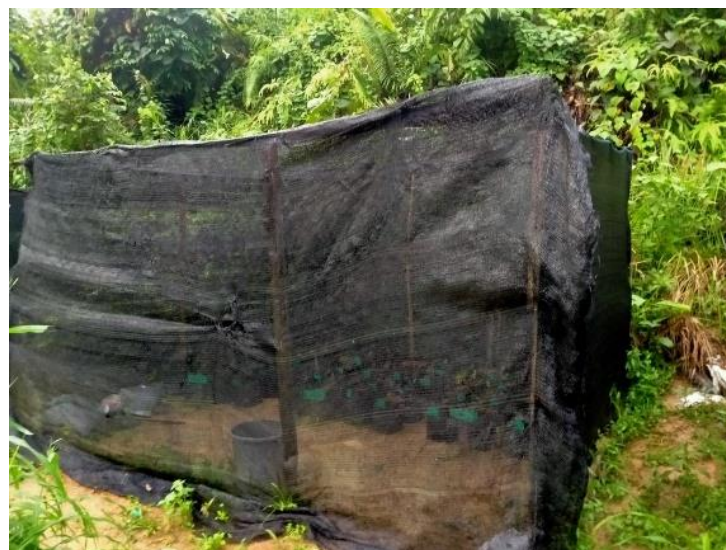
Gambar 2 . Tempat Penelitian