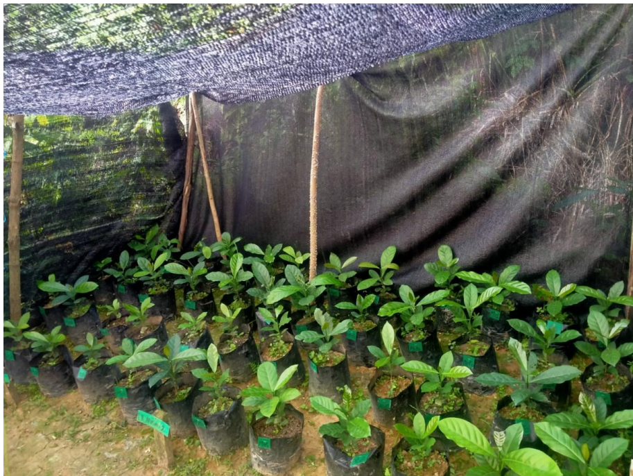
Gambar 16 . Bibit Kopi Semua ulangan umur 90 HST