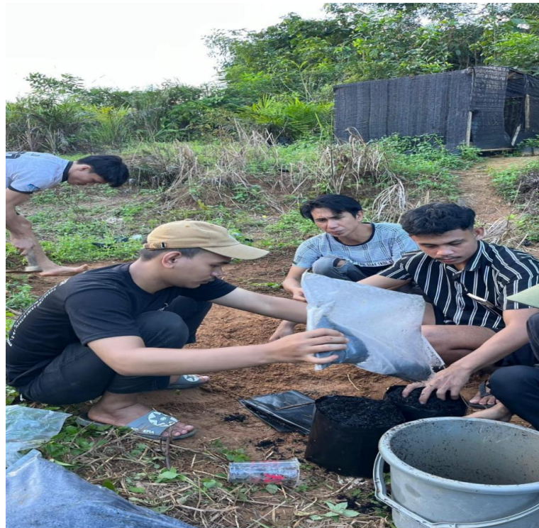
Gambar 5. arang sekam padi