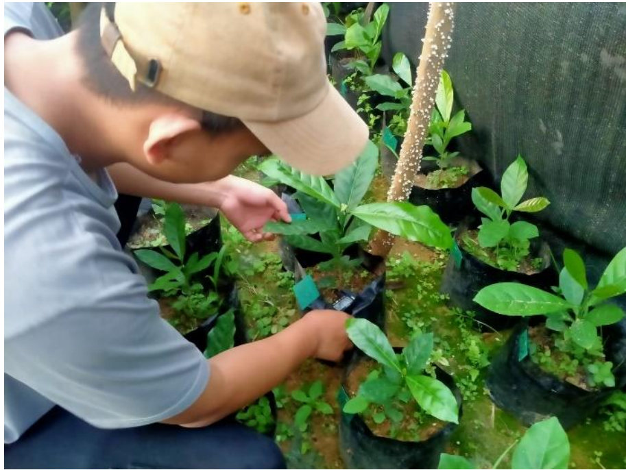
Gambar 15 Penghitungan Jumlah Daun umur 90 HST