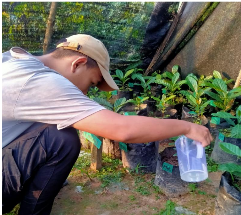
Gambar 10. Pengaplikasian Pupuk Mono Kalium phosfat (MKP)