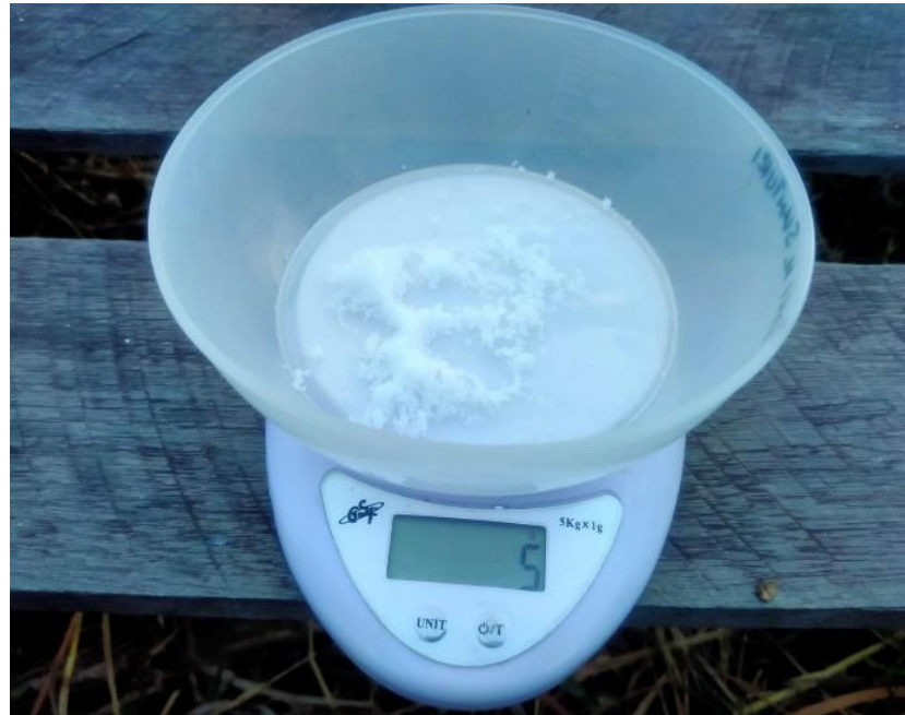
Gambar 7 dosis MKP 5 gram