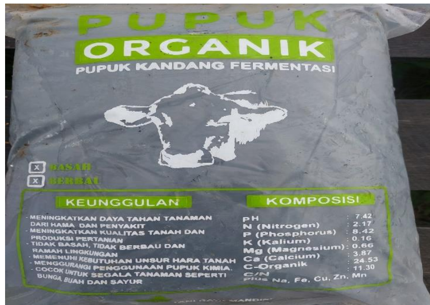
Gambar 3. pupuk Kandang Sapi