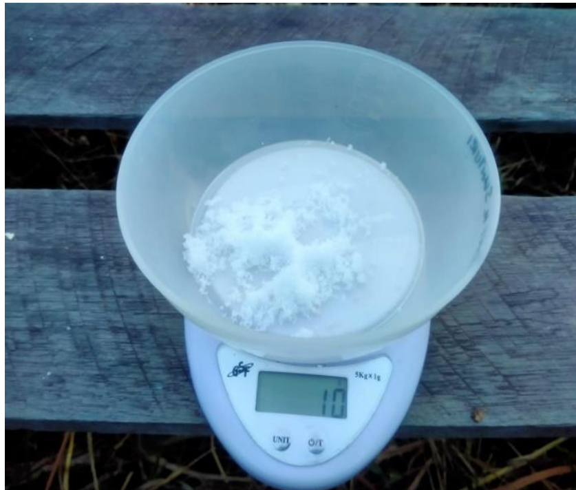
Gambar 8 dosis MKP 10 gram